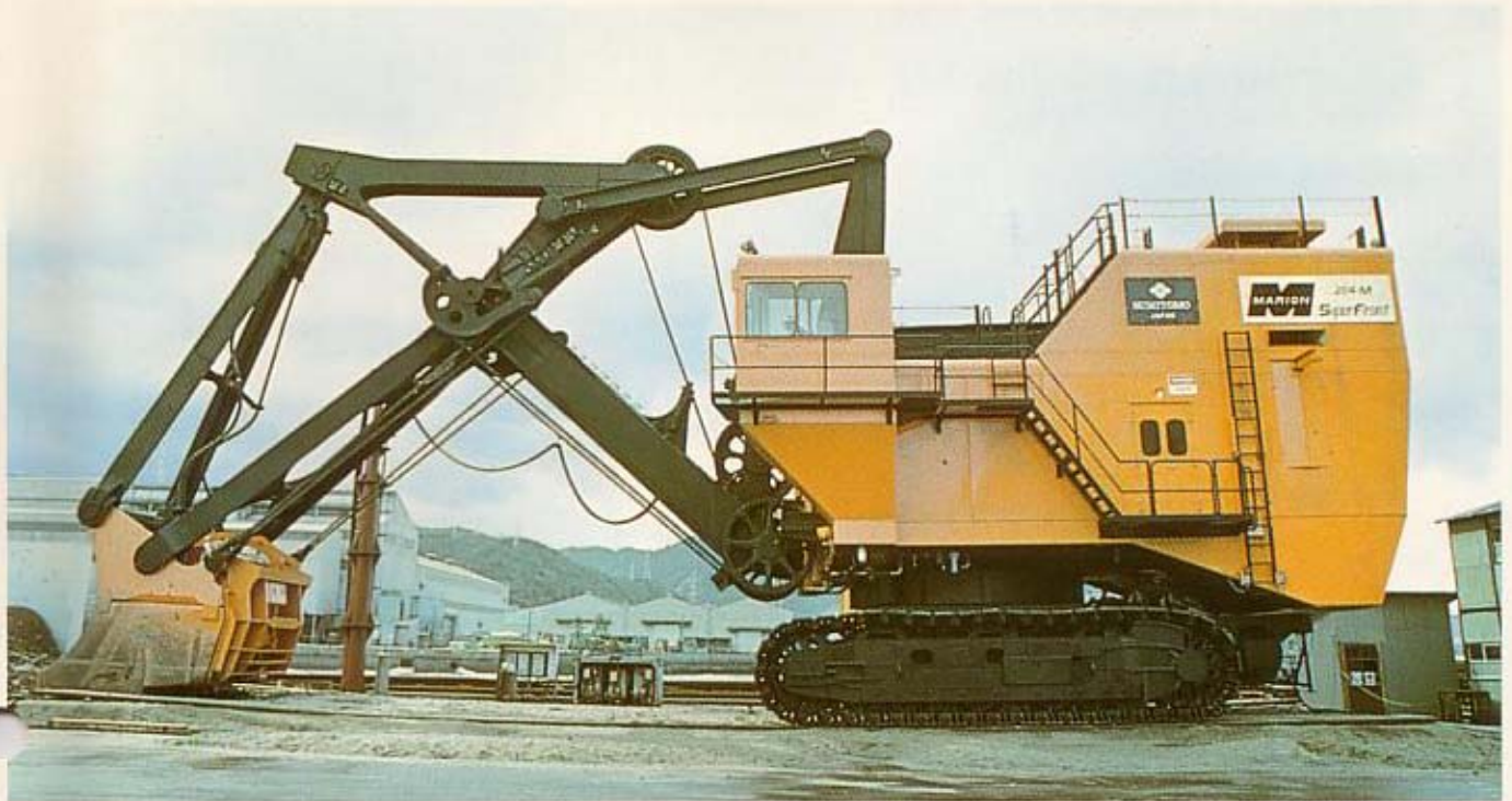
▲MARION M204(25m 2 )